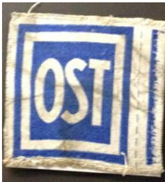
Kennzeichen „OST“ für Zwangsarbeiter*innen aus der Sowjetunion 12 (Bildsatz von Doc.Heintz – Lizenziert unter CC BY-SA 3.0)